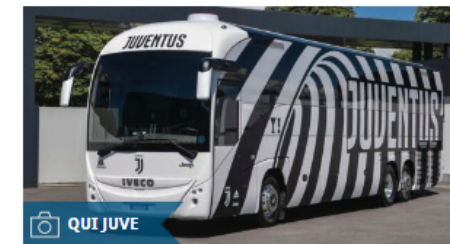
La Juve svela il bus personalizzato da Garage Italia di Lapo Elkann