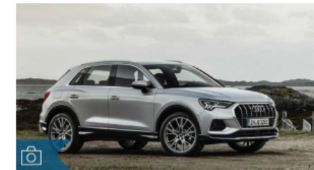
Audi Q3, le foto della nuova generazione del Suv compatto